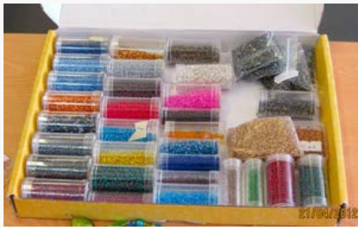
Helmiä sateenkaaren väreissä