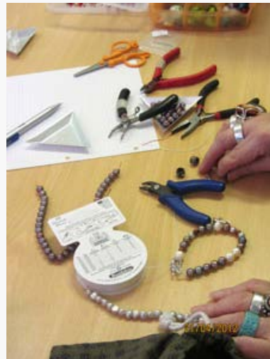
Lisää työvälineitä ja helmiä