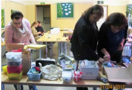
Lisää materiaaleja ja valintaa