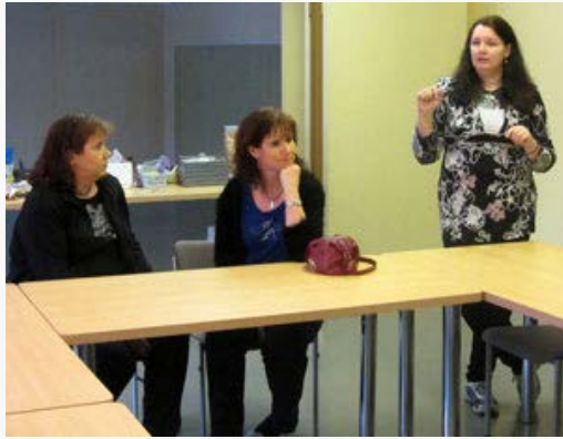
Säde opastamassa alkuun