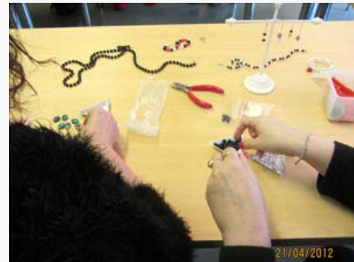
Työ voi alkaa