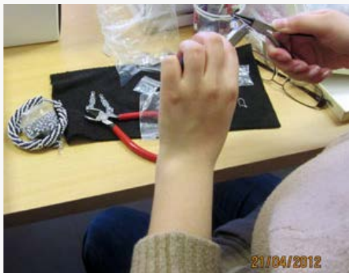
Pihtejä tarvitaan erilaisia