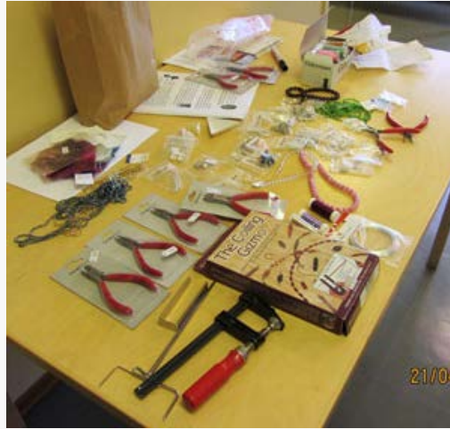
Vielä lisää työvälineitä ja helmiä