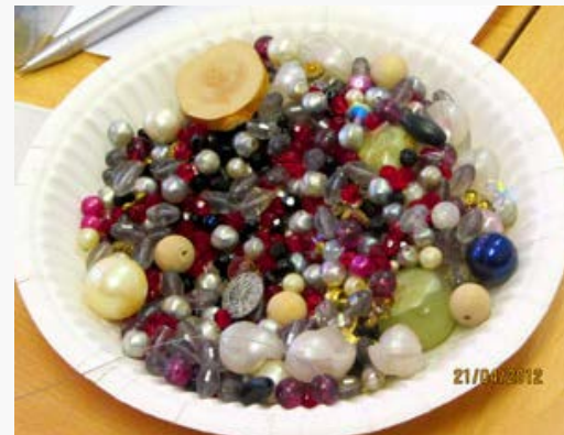
Helmien runsautta ja kirjoa