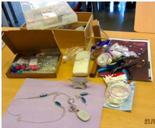
Vanhan korjausta ja tuunausta