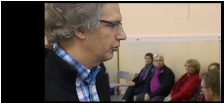
Yle Uutiset Lounais-Suomi 28 pv jäljellä Lisää samankaltaista