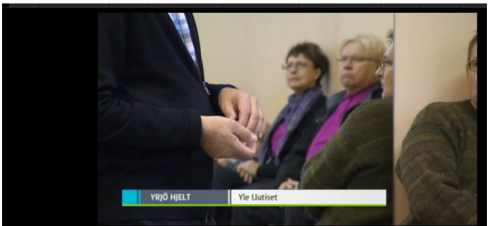
Yle Uutiset Lounais-Suomi 28 pv jäljellä Lisää samankaltaista