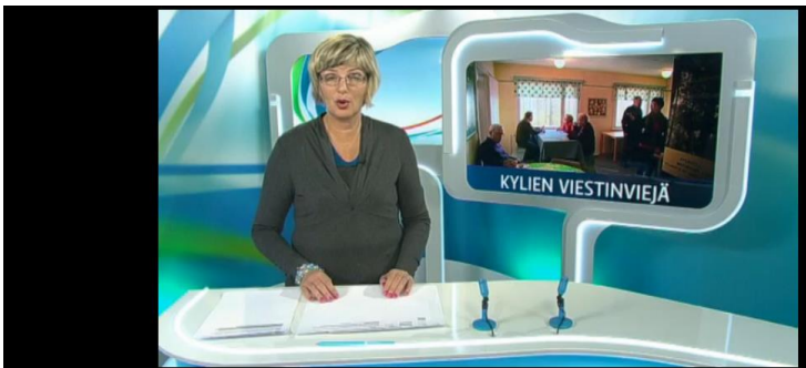
Yle Uutiset Lounais-Suomi 28 pv jäljellä Lisää samankaltaista